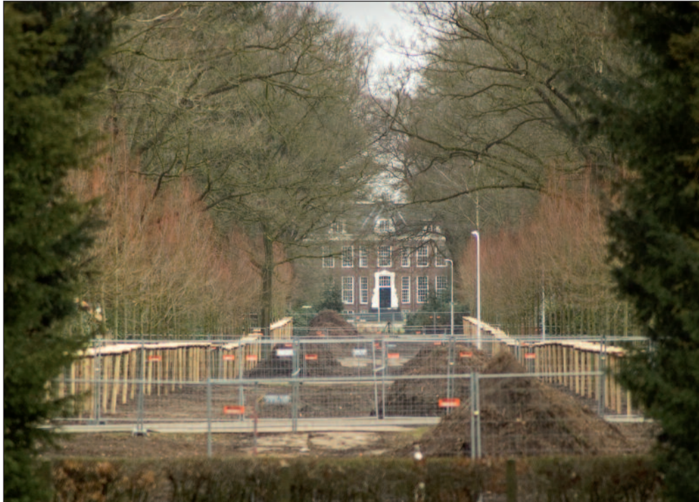
De dichtgegroeide zichtlijn tussen Park Rodichem en Oud-Zandbergen is weer open. Je oog kan nu in een kaarsrechte lijn de afstand van 1056 meter overbruggen tussen twee oude buitenplaatsen. Boven: de zichtlijn richting Oud-Zandbergen. Onder het uitzicht vanuit Oud-Zandbergen naar Park Rodichem.